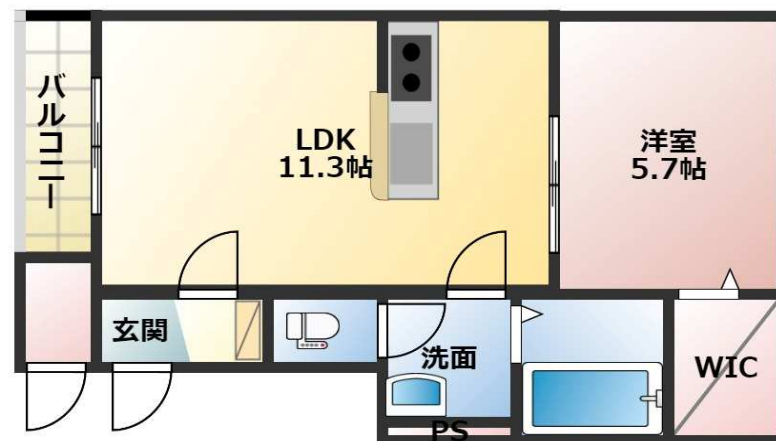
例 1号室 図面